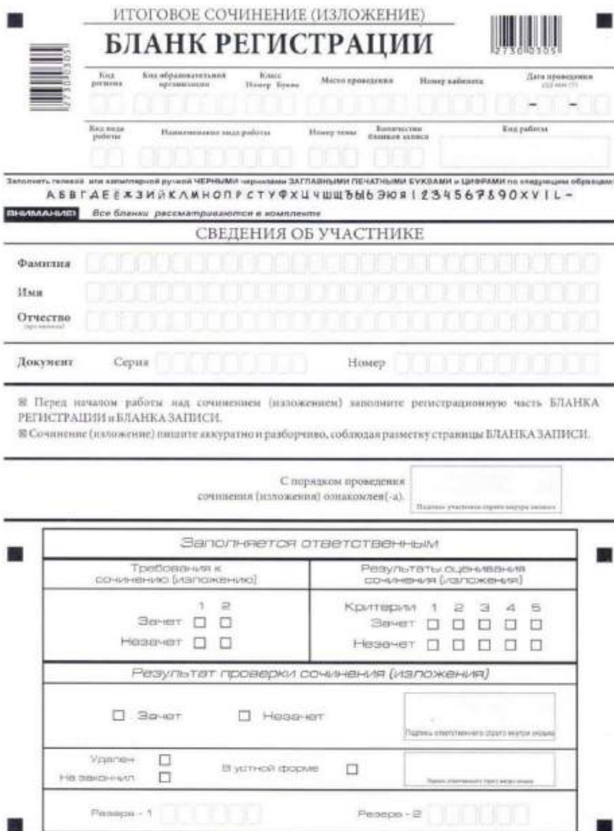
Рис. 1. Бланк регистрации

3. Заполнение бланка регистрации итогового сочинения (изложения) Бланк регистрации (рис. 1) состоит из трех частей - верхней, средней и нижней.