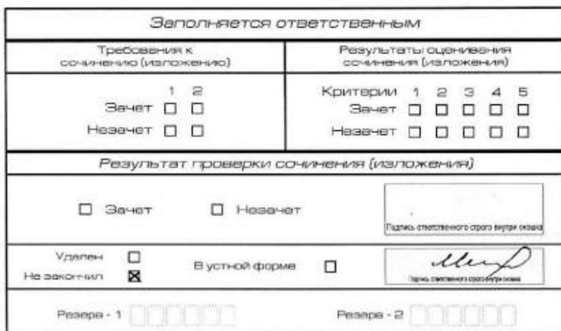
Рис. 12. Заполнение полей нижней части бланка регистрации (завершение написания сочинения (изложения) по уважительным причинам)